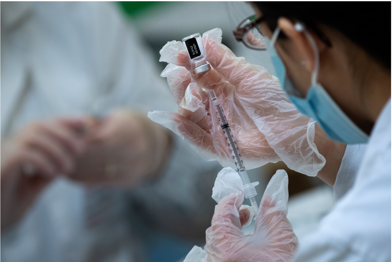
beeld ter illustratie.

Intussen was er een heftige discussie ontstaan over de oorzaak van deze epidemie. De predikant raakte erbij betrokken, omdat hij de plaatselijke artsen aanspoorde om de bevolking in te enten. Een van zijn slaven had hem verteld dat hij als kind in Afrika was ingeënt. Dat proces bestond al eeuwen in de Aziatische en Afrikaanse traditionele geneeskunde. In China was het de gewoonte om gedroogde en gemalen korstjes van pokken in de neusgaten van de patiënt te blazen.