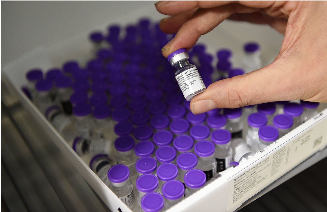
Het Pfizer-BioNTech vaccin.

Uiteraard zijn preventieve middelen of maatregelen die tegen Gods geboden ingaan niet geoorloofd. Dat is met de meeste middelen niet het geval: preventief borstonderzoek, levertraan, Jozozout. Denk ook aan een gezonde leefstijl waarbij alcohol, drugs, sigaretten en calorierijk voedsel vermeden worden. De beschermingsmaatregelen rond corona vallen ook onder preventieve zorg: afstand houden, handen ontsmetten, gezonde voeding en mondkapjes.