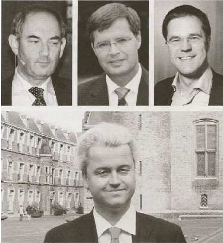
Welke personen er ook in de regering komen, als die zich niet richt tot de Wet en tot de Getuigenis, dan zal het geen dageraad hebben.

Amsterdam, waar een groot bevrijdingsbal met dansorkest en draaiorgel georganiseerd werd; red.] ons een alledroevigste kijk. ( ..) En dit is voorzeker helaas allerminst de enige gelegenheid waarbij met geld uit de overheidskassen bevorderd wordt dat ons volk in een ijdel, zondig vermaak opgaat en dat met allerlei kermisvermaak de herdenkingsdag van 5 mei tergend, schrikbarend verzondigd wordt.