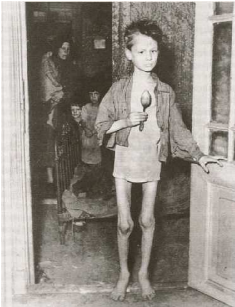
De Hongerwinter van 1944-1945. Wat een leed is er toen in ons land geleden, vooral in de grote steden!

land bestreden hebben en zelfs daar waar men de VI's in de lucht zag verschijnen. Voorwaar, er bestaat alle reden voor om de beëindiging van de bezetting en van de oorlog in ons land (...) ootmoedig en dankbaar te gedenken. Doch voordat wij daarover gaan schrijven, willen wij toch iets zeggen over de oorzaak van de gesel waarmede wij geslagen zijn.