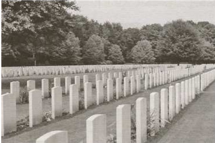
De kerkhoven in ons land zijn getuigen van de grote offers die de Amerikanen, Canadezen, Engelsen en zo vele anderen hebben willen brengen voor de bevrijding van ons land.

te schatten. Ook een regering niet; stellig de overheid niet die van Godswege verplicht is Hem te gehoorzamen, zich naar Zijn getuigenis te richten en Hem in alles te erkennen.