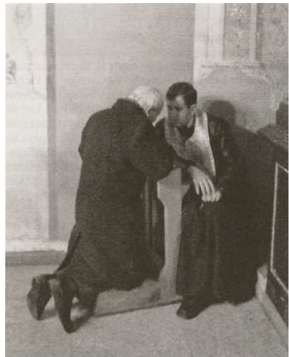
Ter verdediging van de biecht beroept rome zich - geheel ten onrechte - op Jacobus. Ook door middel van de biecht tracht rome de gelovigen aan zich te binden en in haar macht te krijgen.