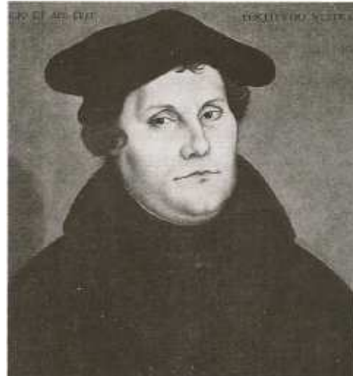
Niet door het zwaard, maar door de pen behaalde Luther zijn overwinningen op rome.