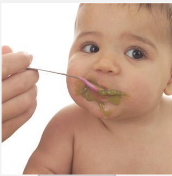
Veel te jong om aan God te denken