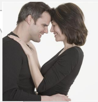
Veel te gelukkig om aan God te denken