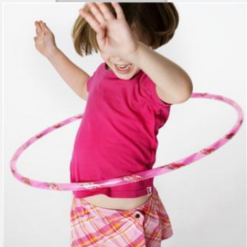
Veel te speels om aan God te denken