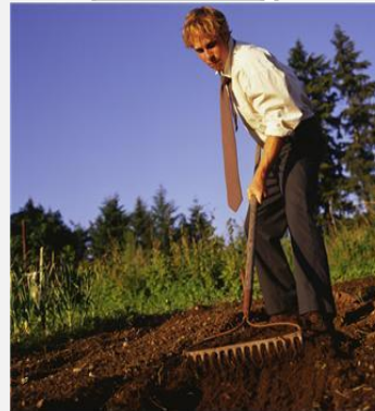
Veel te druk om aan God te denken