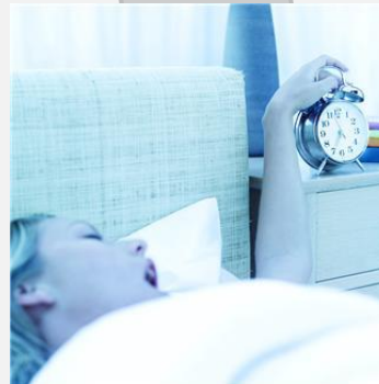
Veel te moe om aan God te denken