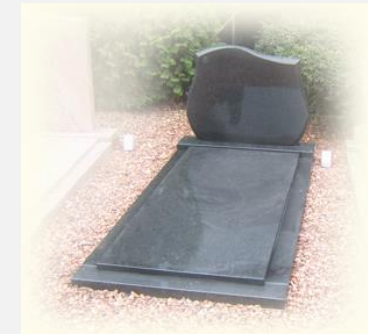
TE LAAT om aan God te denken