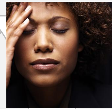
Veel te veel zorgen om aan God te denken